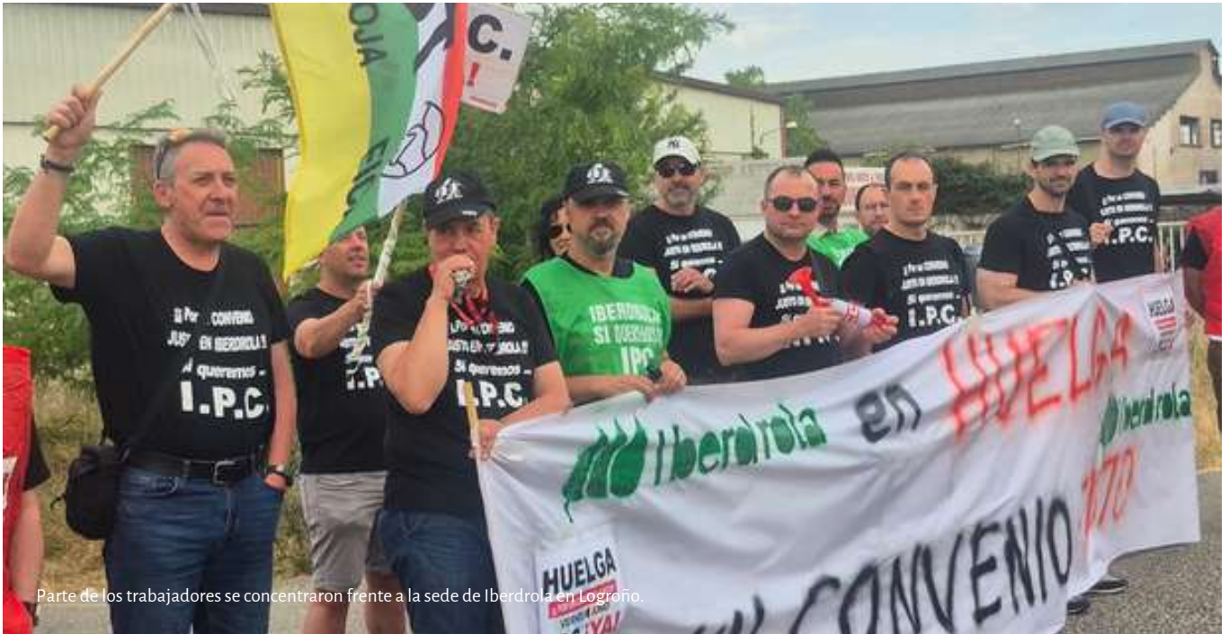
Parte de los trabajadores se concentraron frente a la sede de Iberdrola en Logroño.