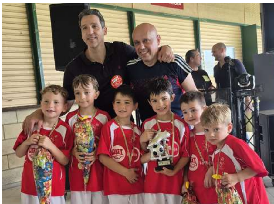
Arriba, asistentes al acto cívico en el Cementerio de La Barranca. A la izquierda, comida popular en Las Norias y equipo vencedor del triangular de fútbol Primero de Mayo.