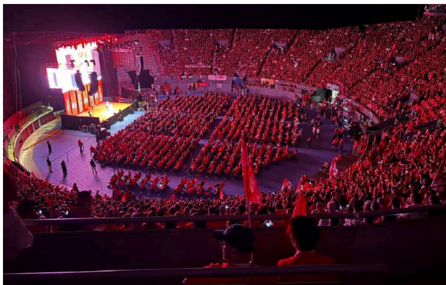
Aspecto que presentaba el Palacio de Vistalegre, lleno a reventar.

Así, el sindicato considera que "el crecimiento económico debe trasladarse de forma real al bolsillo y al bienestar de las familias, no