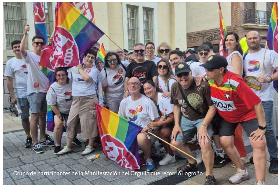
Grupo de participantes de la Manifestación del Orgullo que recorrió Logroño.

UGT La Rioja volvió a participar activamente de los actos organizados por Gylda para la celebración del Orgullo LGTBI y cuyo acto central fue la gran manifestación que recorrió Logroño el pasado sábado, 27 de junio. Una cita con la libertad y la vida, bajo el lema “Orgullo, Disidencia y Resistencia”.