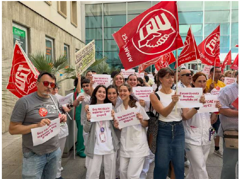
Concentración en el Hospital San Pedro.

Esta reivindicación se ha planteado en numerosas ocasiones por UGT Servicios