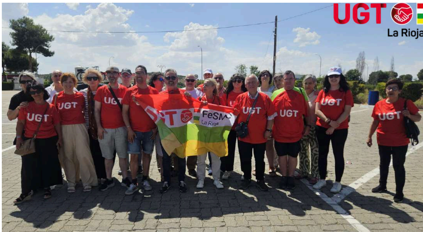
Miembros de la delegación riojana que reunió en Vistalegre a más de 11.000 personas de toda España.