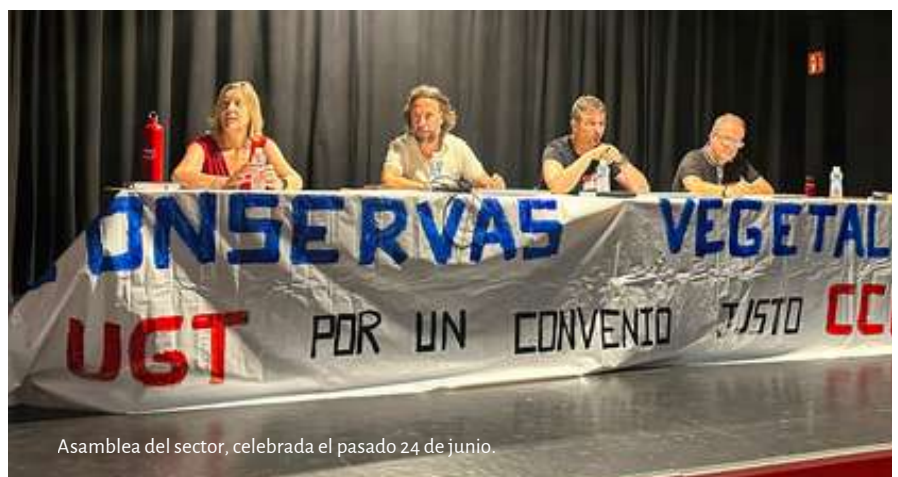
Asamblea del sector, celebrada el pasado 24 de junio.

UGT FICA continúa en plena negociación del convenio del sector de Conservas Vegetales para solventar los principales escollos, centrados en la reducción de jornada (es uno de los convenios con más horas), la revisión del obsoleto sistema de categorías profesionales, una subida salarial digna y el complemento al 100% por accidente laboral.