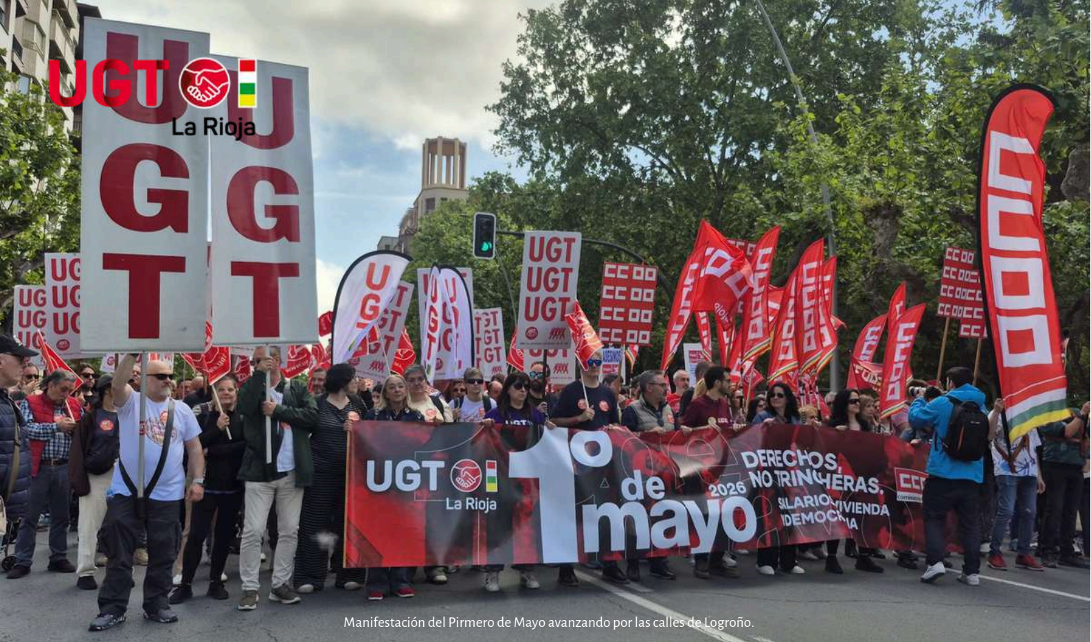
Manifestación del Primero de Mayo avanzando por las calles de Logroño.