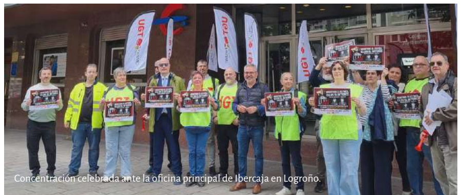
Concentración celebrada ante la oficina principal de Ibercaja en Logroño.

FeSMC UGT La Rioja se concentró el 30 de abril frente a la oficina principal de Ibercaja para visibilizar las condiciones laborales de la plantilla. FeSMC UGT denuncia que Ibercaja ha aumentado su volumen de negocio un 15% de los últimos diez años y más de un 400% su beneficio (de 84 millones a 346 millones de euros en 2025). Y, sin embargo, es la plantilla peor pagada del sector, con salarios mínimos y sufriendo crisis, EREs y recortes de beneficios sociales. Por otro lado, FeSMC UGT denuncia la entidad marca unos objetivos prácticamente imposibles de