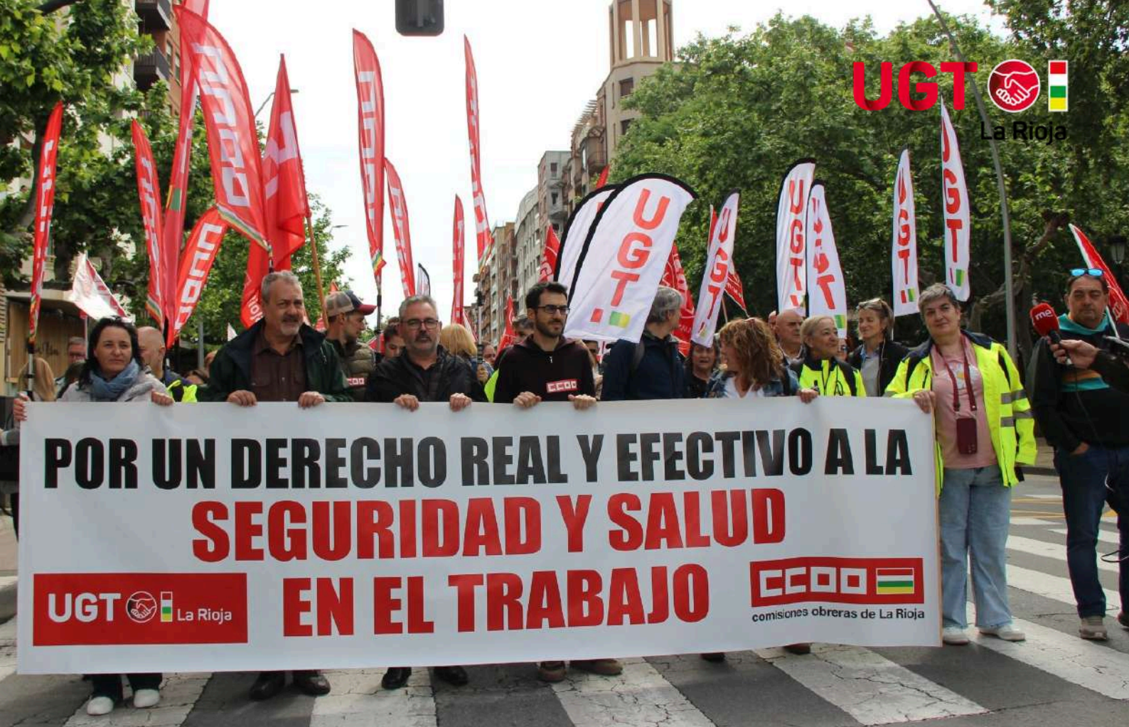
Manifestación conjunta celebrada el Día de la Salud y Seguridad en el Trabajo en Logroño.