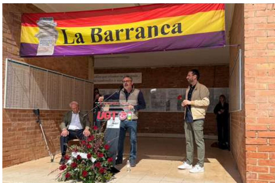
Acto cívico en el Cementerio de La Barranca.

UGT y CCOO volvieron a llenar las calles este Primero de Mayo en Logroño en una manifestación marcada por el rechazo a las guerras y sus consecuencias económicas. "Derechos, no trincheras. Salarios, vivienda y democracia". Cinco palabras que sirvieron de paraguas para denunciar "los ataques, invasiones y agresiones al derecho internacional, que están siendo sistemáticos", así como a las consecuencias que pagamos las personas trabajadoras "debido al aumento desmedido de la energía y del precio de la cesta de la compra". Los dirigentes de ambas organizaciones sindicales coincidieron en gritar "No a la guerra!", al tiempo que exigieron el reparto de la riqueza mediante un