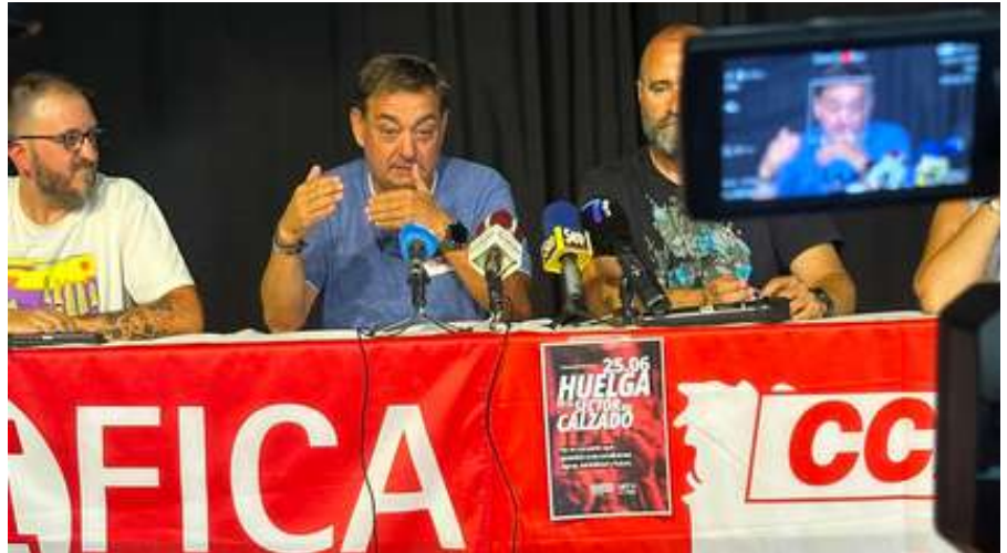
El secretario general de UGT FICA explica la situación a los numerosos asistentes de las asambleas celebradas.

Además, el preacuerdo recoge una cláusula de revisión salarial sobre el IPC real con un tope del 1,5% en 2026 y un 2% para cada uno de los años, en caso de que se produzca una desviación de los precios.