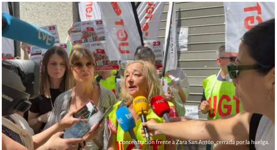
Concentración frente a Zara San Antón, cerrada por la huelga.

El preacuerdo establece que la diferencia salarial del convenio se integrará en un complemento que puede ser absorbido en el futuro e imposibilita futuras actualizaciones