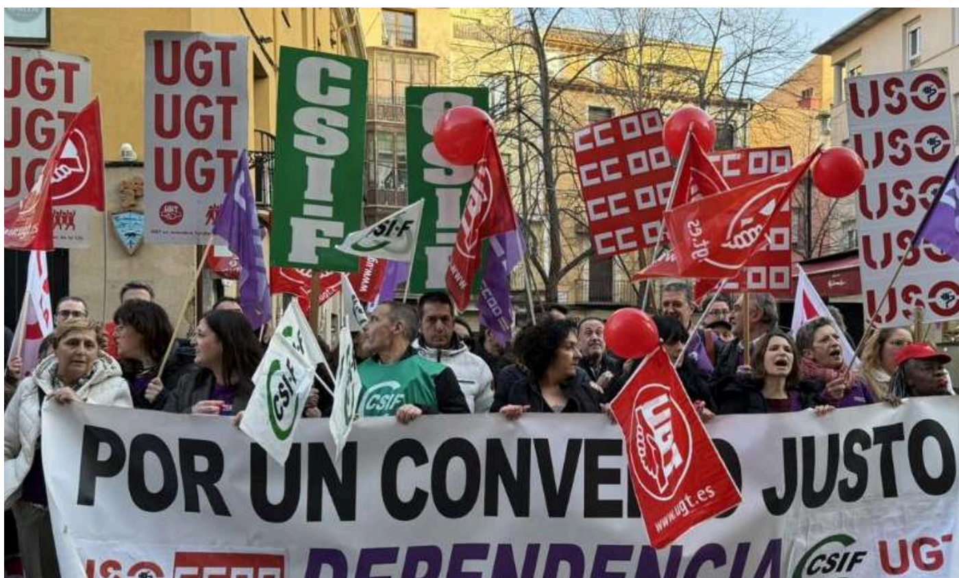
Una de las concentraciones celebradas frente al Parlamento de La Rioja por las trabajadoras y trabajadores del sector.