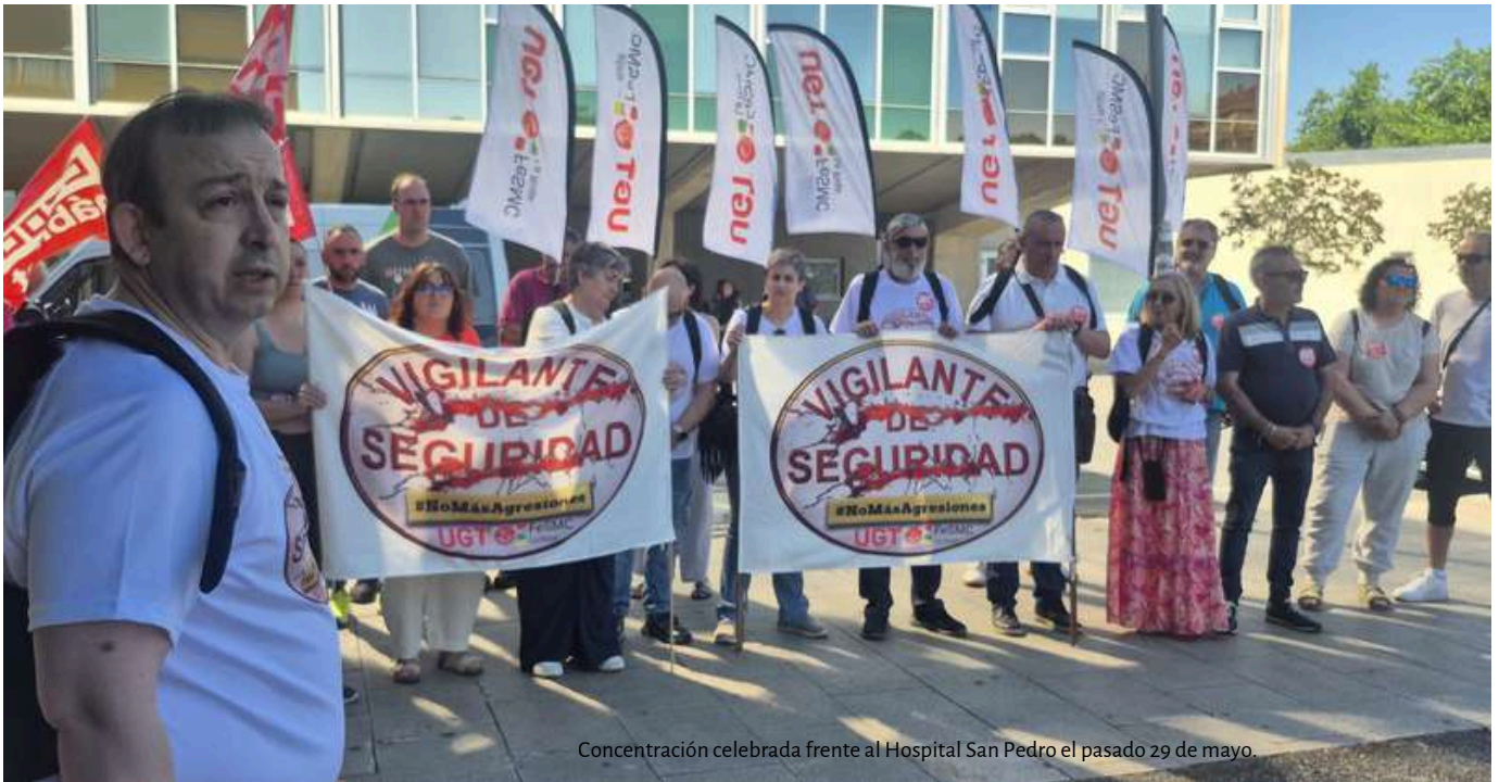
Concentración celebrada frente al Hospital San Pedro el pasado 29 de mayo.