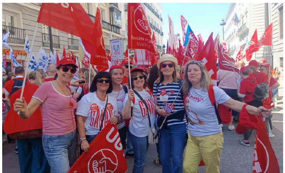
Una delegación de La Rioja también participó en la manifestación por la reclasificación de los técnicos medios y superiores en Madrid

UGT SP entiende que no hay excusas para seguir retrasando esta medida. Por eso creemos que es ahora cuando el Gobierno de La Rioja y el SERIS pueden y deben actuar para evitar diferencias entre profesionales que desempeñan las mismas funciones.