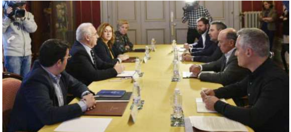
Reunión del Consejo de Diálogo Social, el pasado 25 de marzo, con la participación del secretario general de UGT de La Rioja

El Consejo Riojano del Diálogo Social ha aprobado, al fin, la creación del Observatorio de la Industria de La Rioja, un instrumento de participación social que pretende impulsar la realización de estudios detallados de este sector.